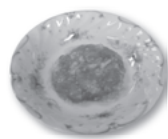
5 もっちりチーズおやき