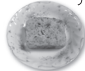
4 ウシクサレ(塩ケーキ)