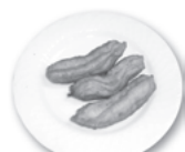
1 さつま芋のチュロス