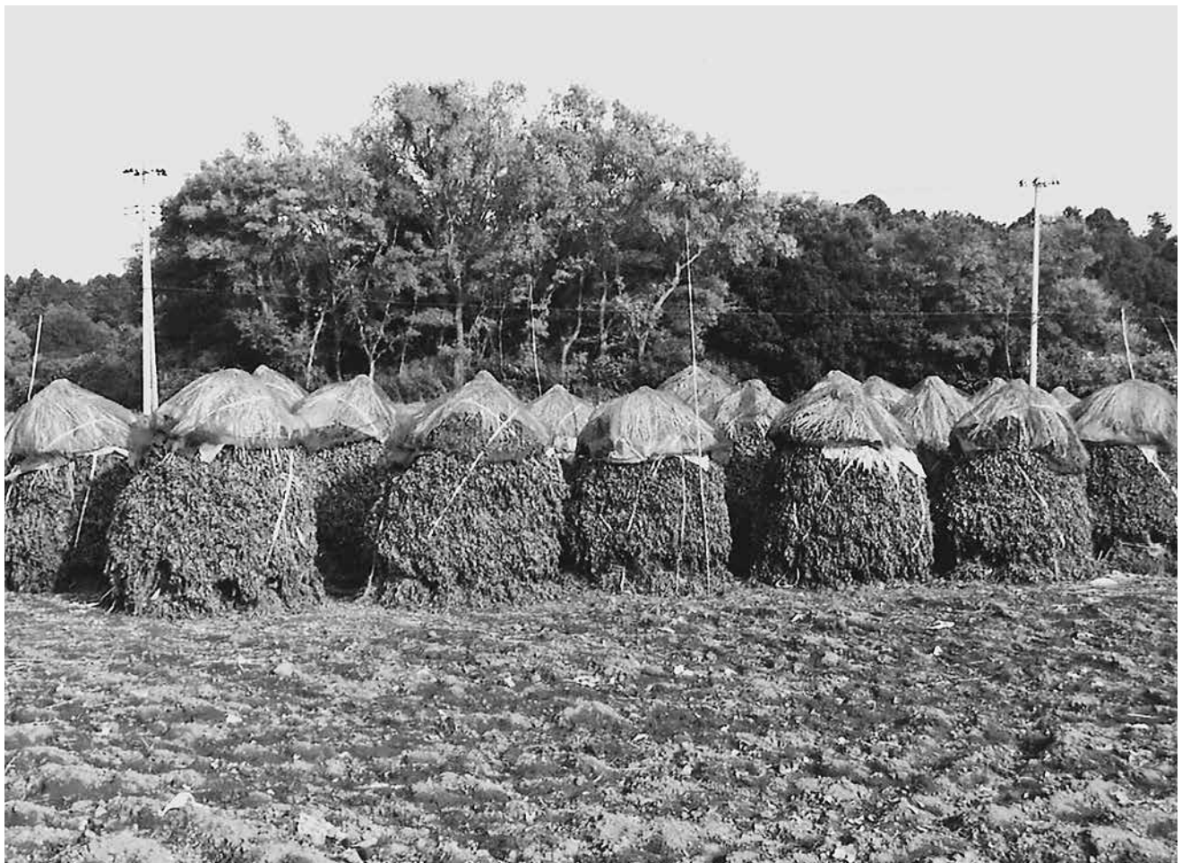
牛久特産落花生ボッチ（牛久市南部地区内）

発行所 牛久市農業委員会 住 所 牛久市中央3-15-1 電 話 029-873-2111(代) 再生紙を使用しています