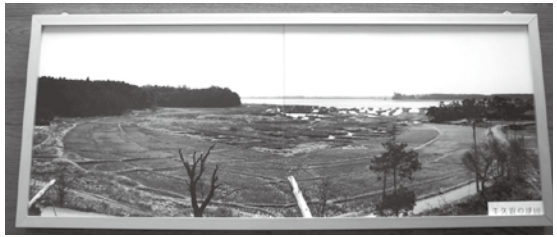
写真は、三日月橋生涯学習センターフロアに掲額されている新地町地内の三日月橋付近に点在していた浮田。この浮田は、昭和50年(1975年)以降稲荷川土地改良区施工の土地改良によって消滅した。

ところで、牛久沼の場合は、江戸幕府の徳川将軍が第三代家光治世下で、関東郡代伊奈忠治指揮により『かこい2000間(3640m余)堤』が築かれ、概ね今日の沼域が確定した。さらに第八代将軍吉宗治世下で、豪農桜井庄兵衛が36年の歳月を費やして新田開発の普請を行なったが、明暦3年(1657年)に中止した。それ以降、牛久沼のほとりの新地村(現新地町)などの農民が浮田の造成を行なった。戦後の昭和30年(1955年)前後からは、