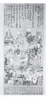
十六羅漢像(模写画)

金龍寺は、室町幕府第4代將軍足利義持治政下の応永24年(1417年)に新田義貞の四男貞氏が、上野国新田郡金山(現群馬県太田市)に父義貞の霊を祀って創建した。その金龍寺は貞氏九代の子孫由良国繁が天正18年(1590年)に豊臣秀吉より牛久5435石を宛行われて牛久城に移ってきた翌年に東林寺城跡(現新地町地内)に移された。75年を経て、国繁の曾孫にあたる貞房が寛文6年(1666年)3月に今の地