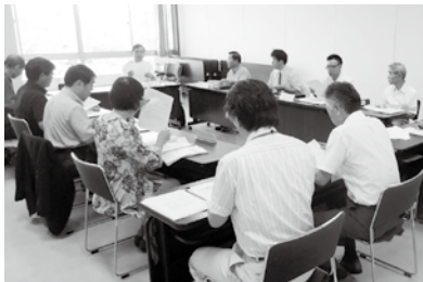
牛久市環境審議会での審議の様子