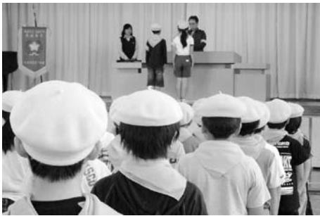
神谷小学校の入団式

小学生の交通事故ゼロを目指して、市内の各小学校では、5・6年生が交通少年団員として積極的に交通安全の活動をしています。