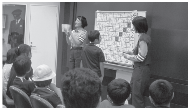
警察官の質問に答える牛久小学校の交通少年団員

牛久小学校の交通少年団員(5・6年生の参加希望者28人)の皆さんが、茨城県警察本部を見学し、警察官の仕事や交通安全のお話などを聞く研修会に参加しました。通信指令室や交通管制センターを見学し、110番の掛け方や自転車シミュレーションを体験しました。