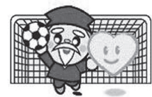
守ろう いのち IBARAKI GATE KEEPER

自殺は、孤立の病とも言われていることから、現在、県では市町村および各種団体などと連携を図り、「つながるわ」・「ささえるわ」茨城いのちの絆キャンペーンを実施しています。周囲との絆を回復することが自殺防止につながります。心に悩みを抱えている人がいたら、声を掛けてください。