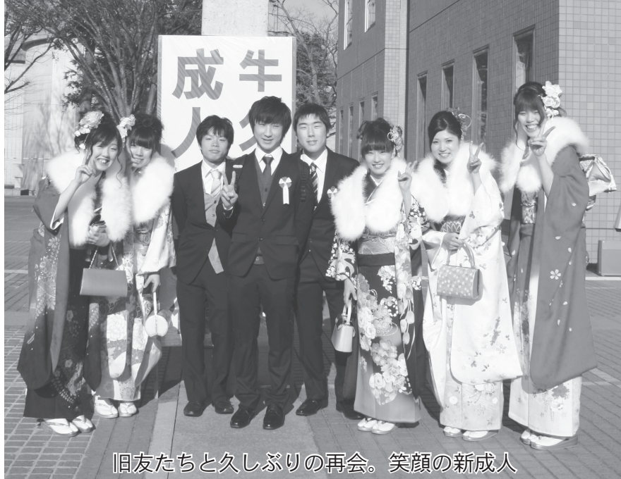
旧友たちと久しぶりの再会。笑顔の新成人

第2部では、成人式実行委員会によるスライドショーが行われ、中学生時代の写真がスライドに流れると、参加者から「懐かしい」などの声や笑い声が上がりました。