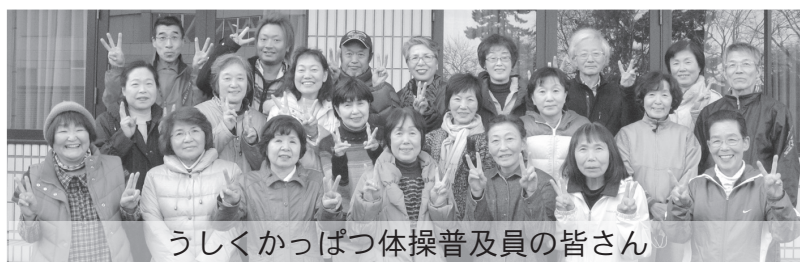
うしくかっぱつ体操普及員の皆さん

す。待ちの笑顔がさいにご参加ください。載せています。り「裏面に掲援センター便毎月回覧の「支できる日程を区ごとに参加ませんか? 地域を運んでみ足を集まりに皆さんも地していきます!