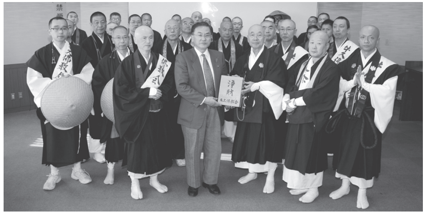
寄付金を渡す牛久市仏教会と真言宗豊山派県布教師会の皆さん