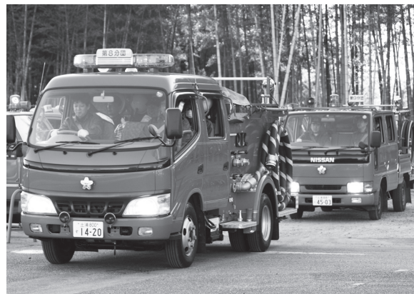
消防車両を運転する消防団員たち