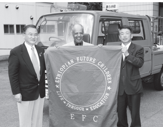
エチオピアへ贈られる消防自動車

エチオピアでは、現在でも火事の際に葉っぱでたたいて火を消している所もあります。ガライヤ理事長は、「消防車を寄贈されるのは初めてなので、早く使い方を覚えたい。消火活動のほかに給水のためにも使わせていただきたい。これからも両国の懸け橋になりたい」と話していました。