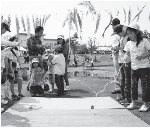
昔ながらの遊びを楽しむ子どもたち

そのほかにも、昔懐かしいけん玉やこま回しなど体を使った遊びに、子どもたちは大喜び。初めて見る遊びに子どもたちは戸惑いながらも、大人たちから遊び方を教わり、次第にこつをつかみました。