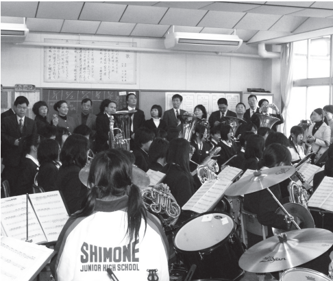
吹奏楽部の活動を見学する視察団

視察団の一人は、「参考になることがたくさんあり、ぜひ当市の学校教育にも取り入れたい」と意欲的に話していました。