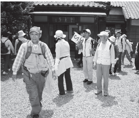
雲魚亭を見学する参加者たち

牛久自然観察の森・遠山谷津田コース(約21km)と牛久沼コース(約11km)の2コースが用意され、参加者たちは自分の脚力に合わせたコースを選んでウォーキングを楽しみました。