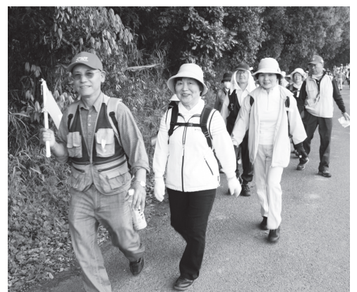
参加者同士仲良く歩行

毎年恒例となったこの健康ウォークには、市内だけでなく、市外からも多くの参加者が集いました。守谷市から来た女性6人グループは「牛久健康ウォークには初めて参加しました。近隣のいろいろなウォーキング大会に参加しています。多くの人が参加しているのに驚きました」と元気に話してくれました。