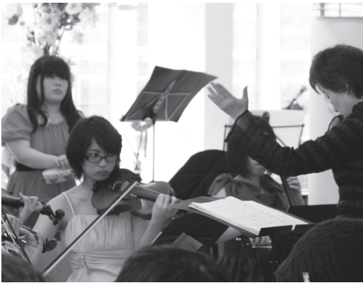
リフレプラザで行われたアンサンブルコンサート

4月29日、ひたち野うしく駅東口にある「ひたち野リフレ」のリフレプラザ2階で、開設を記念した式典と「音楽とアートのコラボレーションコンサート」が開催され、多くの方が訪れました。