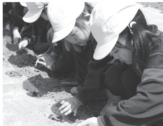
トウモロコシの種まきをする園児たち

4月26日、晴れ渡った青空の下、つばめ保育園の園児たちが遠山町の農地でトウモロコシの種をまきました。