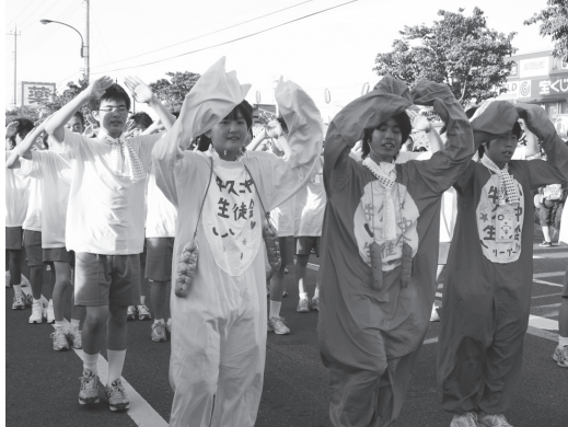
8年連続優勝の牛久第二中学校

メインイベントの「河童ばやし踊りパレードコンテスト」では、初日の事業所・団体の部で牛久第二中学校が8連覇という偉業を達成しました。また、2日目の行政区の部では、東みどり野が見事優勝して息の合った踊りを披露しました。