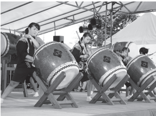
城中太鼓の力強い演奏