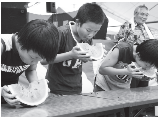
スイカの早食いに悪戦苦闘！