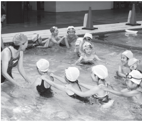
輪になって楽しく水に慣れる子どもたち

練習最後の日には、「これから泳ぐことを楽しんでください」と書かれた修了証を、子どもたちは笑顔で浮かべ受け取っていました。