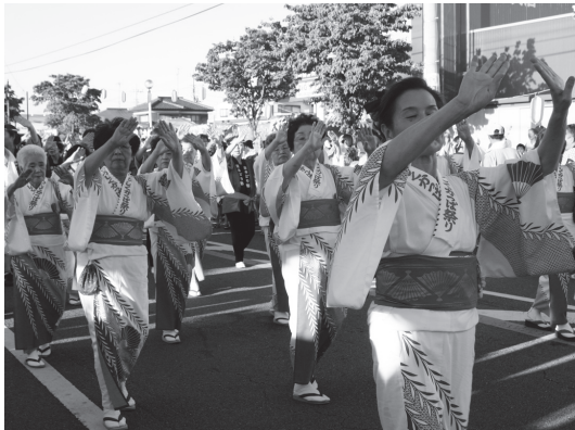
行政区の部優勝の東みどり野