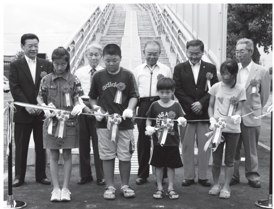
こ線橋を前にテープカットをする出席者たち

7月28日、ひたち野中央地区内の街区公園で、(独)都市再生機構による「ひたち野中央地区こ線橋竣工式」が行われ、線路を挟んで東西を結ぶこ線橋が開通しました。