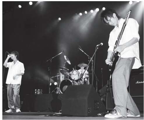
高校生バンドによる熱いステージ

8月9日、牛久で初となる「Fresh Live Fes. '09」が開催されました。このライブでは、牛久にかかわりのある高校生バンドなど9組が参加して、熱いギターやドラムなどの演奏を繰り広げました。