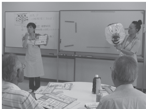
仲間と一緒に楽しく口腔内体操