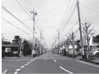
写真② 平成29(2017)年3月撮影