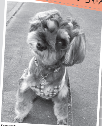
【種類】ミニチュア・シュнауザー(メス5才)