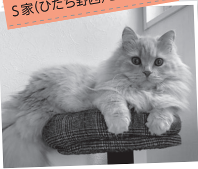
【種類】ラガマフィン(オス1才)