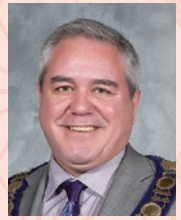
ホワイトホース市長 ダン・カーティス

ホワイトホース市を代表し、根本市長と牛久市民の皆さまに新年のごあいさつを申し上げます。30年以上にわたり、素晴らしい牛久市と共に友好関係を享受できましたことは大変名誉なことです。二つの街の豊かな文化に浸りつつ、互いに啓発しあい、触発し続けるこの姉妹都市の結びつきに感謝いたします。 私たちは、再び我々の学生たちを牛久市に派遣できる日を、そしてまた牛久市の青年たちをお迎えられる日を楽しみにしております。この交流事業は私たちが親しく、そして継続的に学生たちに貴重な経験と好機を提供してあげました。 市長と牛久市にとって良い新年となりますよう祈念いたします。