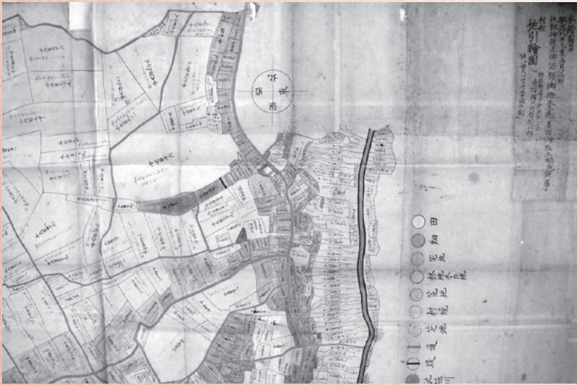
【初公開】「常陸國河内郡柏田村 村控地引絵図」(一部) 明治8年 牛久市蔵

政治体制から人々の生活まで大きく変化があった明治時代の牛久をテーマとした展示を行います。初公開となる地引絵図を中心に、牛久藩主山口家史料なども交え、明治時代の牛久を紐解いていきます。