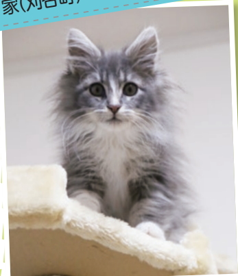
【種類】メインクーン(オス4カ月)

1月に牛久に引っ越してきました。完全に室内暮らしだけど、牛久はとて暮らしいいにゃあ。