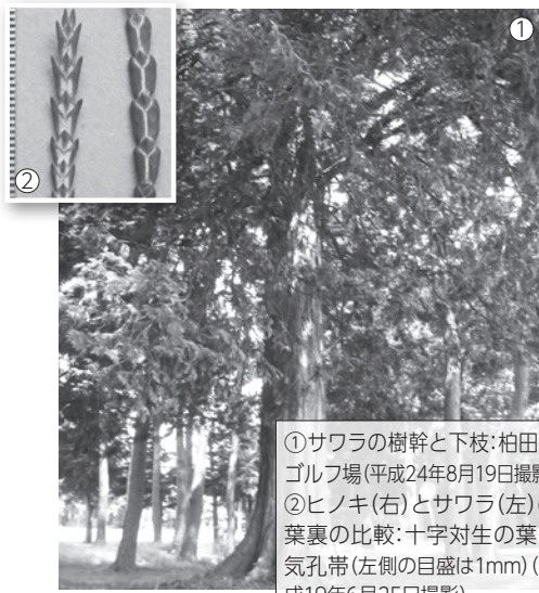
①サワラの樹幹と下枝: 柏田町 ゴルフ場(平成24年8月19日撮影) ②ヒノキ(右)とサワラ(左)の 葉裏の比較: 十字対生の葉と 気孔帯(左側の目盛は1mm)(平 成19年6月25日撮影)

けて狭い薄片にはがれます。葉は 鱗片状で、十字対生して細枝を 包み、先が外側に曲り、長さ3mm 内外。裏面の白色気孔帯が太く、 X字形をしています。これが細く Y字形のヒノキとの区別点です。 花は3〜4月。雄花は楕円形で 小枝の端に1個つき、雌花は球形 果実は球形で長さ5〜7mm、10月 に成熟します。材は耐水性に富 み、風呂桶などに重用されていま す。また園芸品種があり、庭園や 生垣に植えられています。 ※牛久の里山樹木ハンドブック76 ページ掲載。本の問い合わせは牛久自 然観察の森(☎874・6600)まで。 【資料提供】NPO法人うしく里山の会 (文章・石川満夫、写真・渡辺泰)