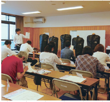
制服業者によるプレゼンテーション

その中で制服についてはアンケート結果をもとに、新デザイン案および現行デザインアレンジ案を検討中。7月下旬から投票を行っています。併せて体操服デザインも検討中です。今後、部活動、通学路、校章、施設開放、PTAなどの協議を進めていきます。