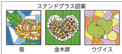
ステンドグラス図案