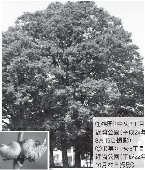
①樹形:中央3丁目 近隣公園(平成24年 8月16日撮影) ②果実:中央3丁目 近隣公園(平成22年 10月27日撮影)

ニレ科ケヤキ属の20〜25mの落葉広葉樹の高木。本州から九州に分布し、市内では斜面林などに自生する他、公園・屋敷・街路などに植栽されています。樹皮は灰色でほぼ平滑、老木になると大きな鱗片となつてはがれ