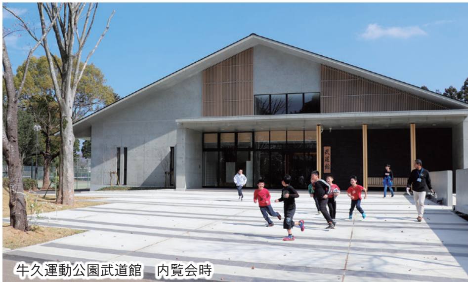
牛久運動公園武道館 内覧会時