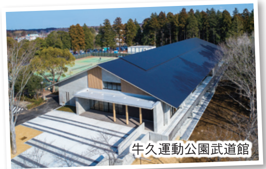
牛久運動公園武道館