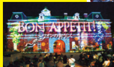
牛久シャトーで プロジェクトシヨウマップング