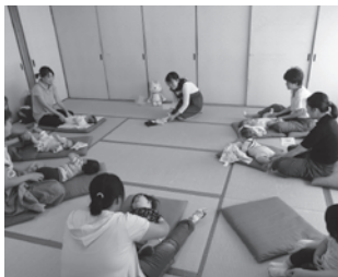
※写真は昨年度の様子(三日月橋生涯学習センター)