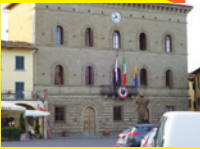
グレーヴェ・イン・キアンティ 市庁舎