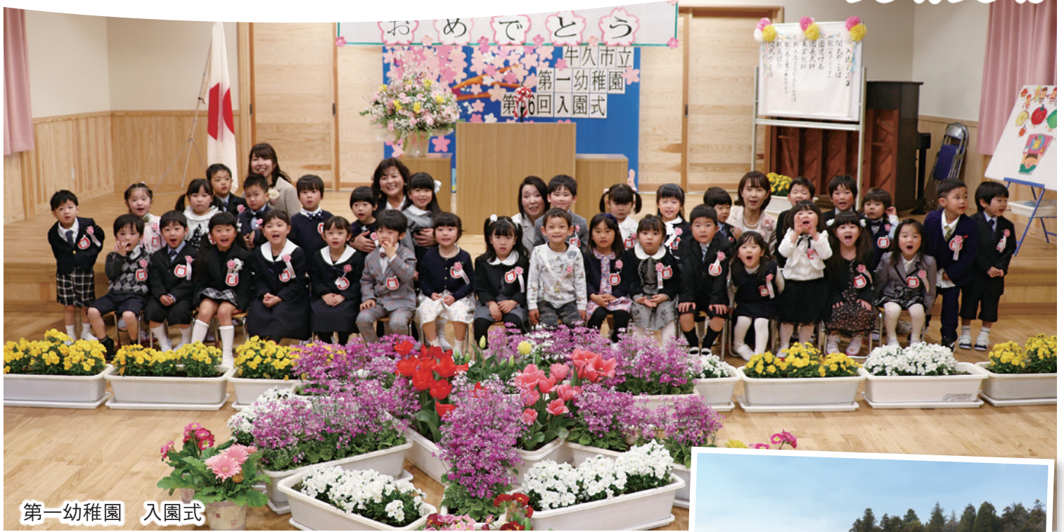
第一幼稚園 入園式