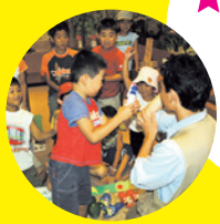
牛久自然観察の森 「森の栗校」