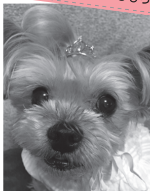
【種類】ヨークシャーテリア(メス:12才)