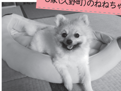
【種類】ポメラニアン(メス:2才)