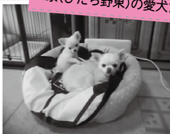
右から虎次郎くん(オス:19才)、鈴ちゃん(メス:1才)【種類】ロングコートチワワ

市では、4月の第1週と第2週に狂犬病予防集合注射を実施します。日時や会場は市ホームページなどでご確認ください。狂犬病はすべての哺乳類に感染し、発症するとほぼ100%死に至ります。日本では過去50年ほど発生事例はありませんが、世界では、日本、ニュージーランド、オーストラリア、イギリスなどの一部の国以外で年間約5万人が亡くなっています。人への感染経路のほとんどが犬です。万が一狂犬病が日本に侵入した場合に備え、犬を登録し、予防接種を受けましょう。