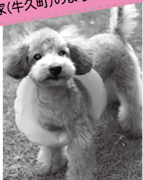
【種類】トイプードル(メス:1才)