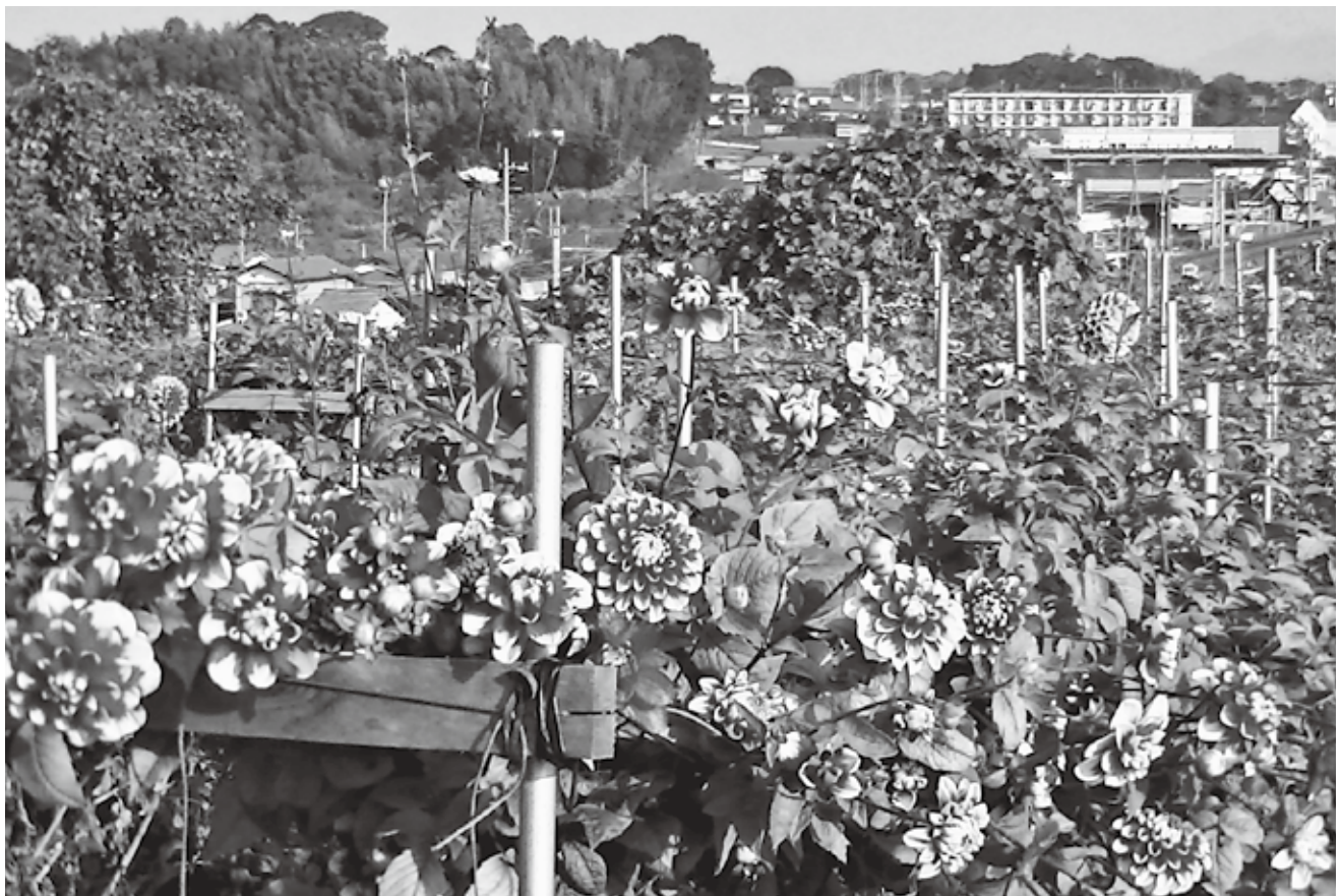
雨ニモマケズ 風ニモマケズ 出荷の最盛期を迎えたダリア畑 ～遠山地区～

発行所 牛久市農業委員会 住 所 牛久市中央3-15-1 電 話 029-873-2111(代) 再生紙を使用しています