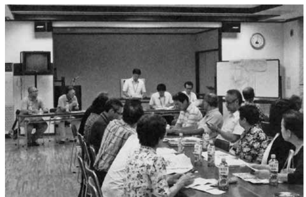
井ノ岡地区農地中間管理事業話し合い