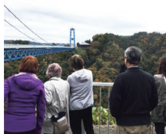
▲富士河口湖町 西湖いやしの里根場 ▲常陸太田市 竜神大吊橋