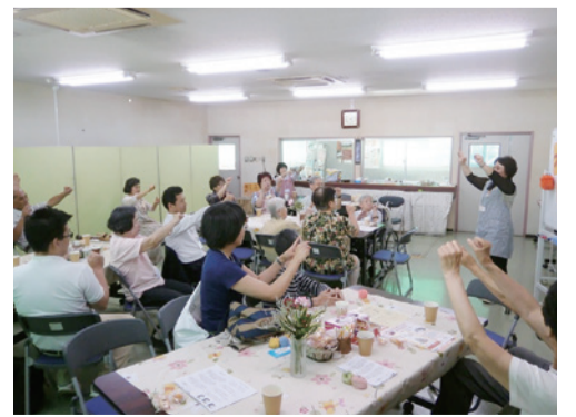
高齢者と地域との交流の様子

(質問) 事業者の選定理由は。 (答弁) 審査基準に基づき13項目を審査、合計点数が一番高かった法人を選定した。 (質問) 予定地の隣地地権者の同意が得られていないが。