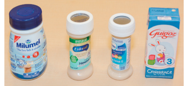
海外で流通する液体ミルク

掲載以外の質問項目 ○路面下の空洞調査 ○避難所へマンホールトイレの設置拡充 ○牛久二中区域外生徒の部活後の足の確保