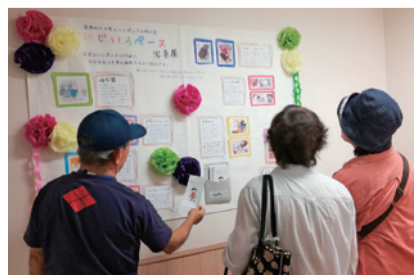
医療的ケア児の家族の会による写真展(庁舎内)

(質問) 日常を送る上で医療的ケアを必要とする子どもと家族への支援は、制度はできてきたが、利用できる社会的受け皿は整備されていない。こども発達支援センターの充実を始め、レスパイト事業やワンストップの相談窓口の設置など市の取り組みは。(保健福祉部次長) 地域全体で十分な支援とサービスを提供できる