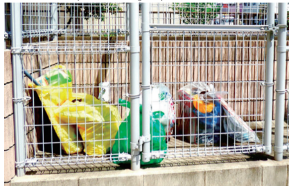
ゴミ集積ボックス

(建設部長) 国道6号牛久市役所入口交差点付近の交通量は約3割増加している。区画線による速度抑制など、安全対策を検討。(質問) 同交差点コンビニ側の渋滞対策として、右折信号もしくは時差式信号設置の考えは。