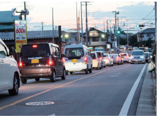
ぶどう園通りから国道6号までの混雑状況