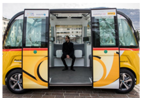
世界初、公共交通としての自動運転バスがスイスで運用開始