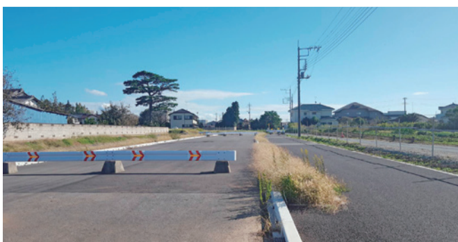
全線開通が待たれる市道23号線