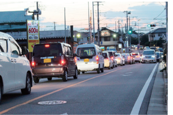
ぶどう園通りから国道6号までの混雑状況