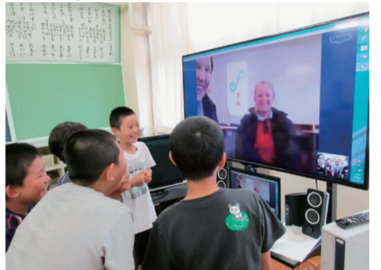
ユネスコスクールに認定された奥野小学校