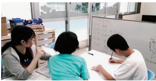
福祉センター内の放課後等デイサービス