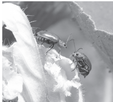
ウリハムシ (瓜葉虫) コウチュウ目ハムシ科

成虫の体長は6から8ミリメートル、頭部と前胸部の幅がやや狭い長卵形をしていて、きれいなオレンジ色に黒い複眼が目立ちます。キュウリやカボチャなど、ウリ科の農作物に被害をもたらす害虫で、よく飛ぶ習性があり、家庭菜園などにもすぐに飛来してくるやつかいものです。初夏から夏に現れ、葉や若い実、時に花びらをかじり、体を中心にまわりながら食べるので、食べ跡は円弧状から丸い形になるのが特徴です。幼虫も土の中で根をかじっています。