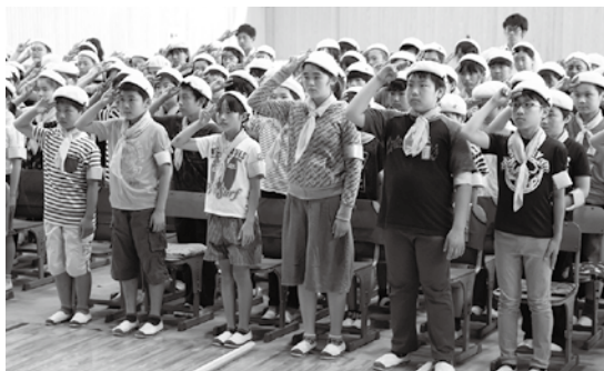
牛久第二小学校の入団式の様子

さらに、12月には作品の入賞者の表彰式が行われ、入賞作品のカレンダーを作成するなど広く交通事故防止に活用されます。