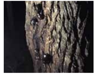
樹液に集まる昆虫 (7月)

夏鳥として飛来する。「ギョシギョシ」と大きな声で鳴く。その葦原の中で一番強いオスが一番高い所で鳴く。