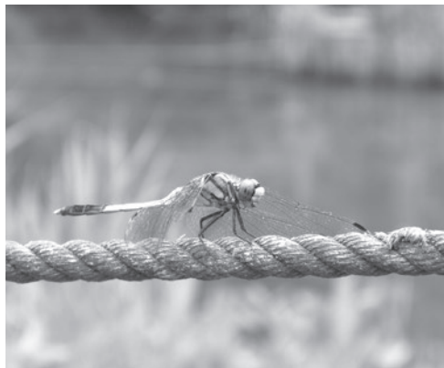
トンボ目トンボ科

平地の水田や池、湿地帯などに生息する中型のトンボで、牛久周辺では5月から10月ごろまで成虫がみられます。まち中の池などで目にする機会も多く、名前・姿ともに最も親しまれているトンボです。成熟したオスは胸部から腹部前方が灰白色の粉で覆われるため、これを塩に見立ててこの名が付きました。若いオスやメスは黒いすじの入った黄土色をしており、その姿から別名「麦わらとんぼ」と呼ばれています。