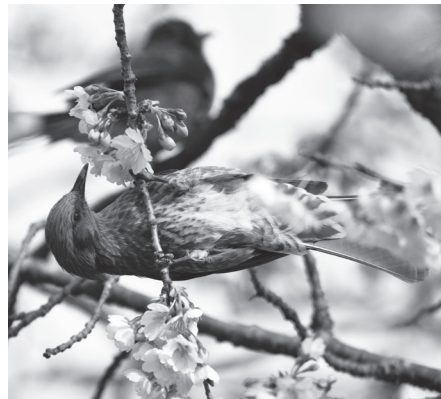
スズメ目ヒヨドリ科

スズメとハトの間くらいの大ささで、体色は地味な灰色ですが「ヒーヨ、ヒーヨ」とよく通る大きな声で鳴き、庭や公園で目にすることの多い身近な野鳥です。春は花の蜜、夏から秋は果実を主食とする美食家で、桜の花にくちばしを差し込んで蜜を吸う姿もよく見られます。一年中姿が見られるため留鳥と思われていましたが、最近の研究で、雪の降る地方のものは冬に南に移動し、関東周辺でも冬はさらに南に移動していることがわかってきました。