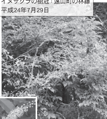
花序：南1丁目雑木林 平成20年5月4日撮影

高さ10mに達する落葉高木で、本州から九州に分布し、市内では斜面林や雑木林に自生しています。葉は互生し、縁に浅い鋸歯があり、葉身は長さ5〜9cmの長楕円形で、先端は尾状にとがり、基部はくさび形です。花序はふつうのサクラとは異なり、前年枝の