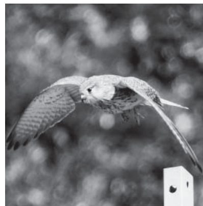
ハヤブサ目ハヤブサ科

翼や尾羽が長くスマートなシ ルエットをした、ハトくらいの 大きさの猛禽類です。市内では、 冬に農耕地や河川周辺の開けた 場所に飛来し、バッタなどの昆 虫や小鳥類、小動物等を捕食し ます。ハヤブサの仲間はずれで飛 ぶと思われがちですが、この鳥 はスピードよりも飛翔技術に優 れていて、飛びながら空中で体 を停止させ、獲物を見つけたら 急降下して捕えます。近年、ね ぐらや繁殖の場として、高層ビ ルや高架道路の橋脚などを利用 する例が増え、市街地周辺でも よく見られるようになりました。