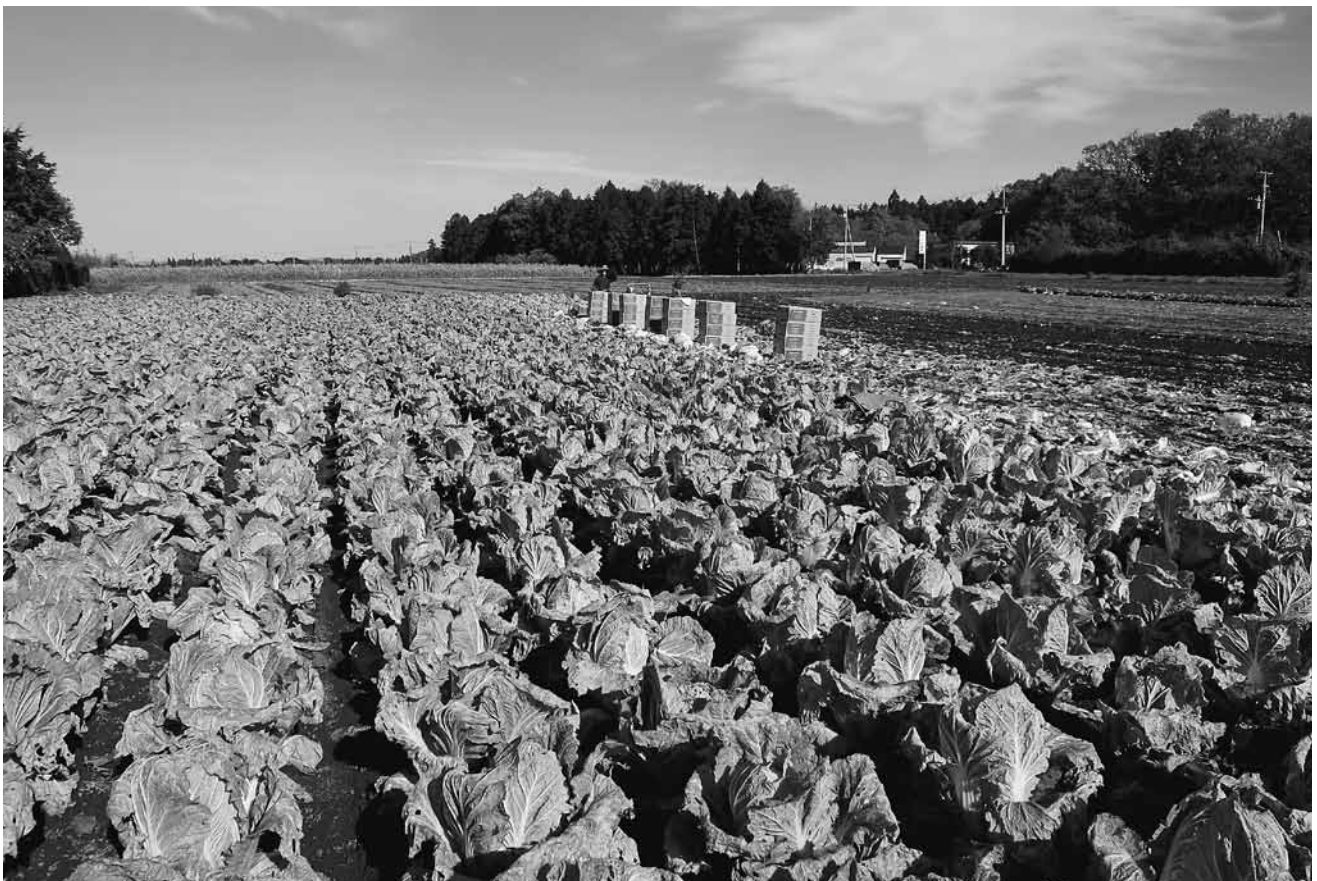
出荷の最盛期をむかえた白菜畑 ～東下根地区～ 寒さで甘さ美味しさUP

発行所 牛久市農業委員会 住 所 牛久市中央3-15-1 電 話 029-873-2111(代) 再生紙を使用しています