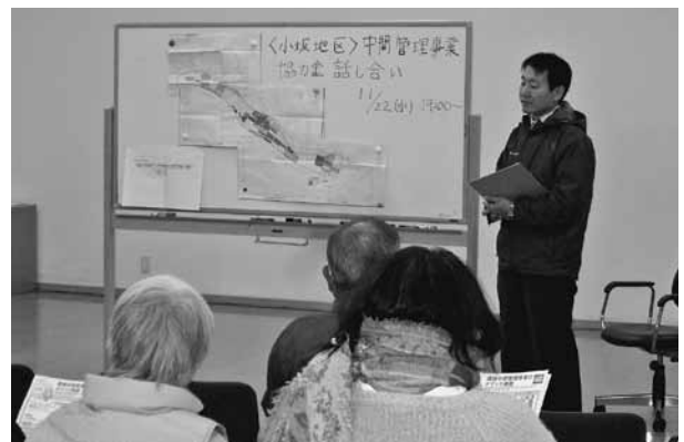
小坂地区農地中間管理事業話し合い