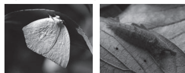
葉の裏や落ち葉に身を隠す昆虫も!