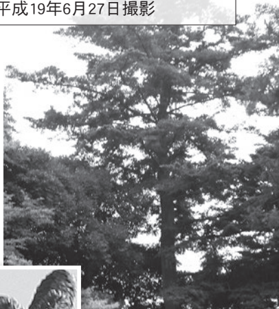
球果：平成19年11月24日撮影

マツ科モミ属の常緑針葉樹で、幹は真つすぐに育ち円錐形の高木になります。日本特産種。岩手・秋田県〜屋久島に分布し、県内では全域にあり、筑波山には巨樹の森林があります。市内では社寺の境内に古木が自生しています。