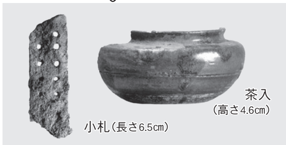
茶入 (高さ4.6cm) 小札(長さ6.5cm)

戦国時代の牛久市は、後北条氏と佐竹氏が激しく対立し、合戦のやむことのない地域でした。そのため、牛久城(城中町)や東林寺城(新地町)など、防衛のための城郭が築かれました。牛久城の北側に位置する明神遺跡(城中町)は、平成25年に太陽光発電設備設置事業に伴う発掘調査が行われ、台地を縦横に区切る、深さ最大約3mの堀などが見つかりました。遺跡からは鉄砲玉や鉄鏃などの武器や、小札(鏡の部品)などの武具が発見され、ここが戦いの地であったことを物語っています。また、天目茶碗や茶入などの茶道具が見つかったおり、茶の湯をたしなむ武士の存在をうかがうことができます。