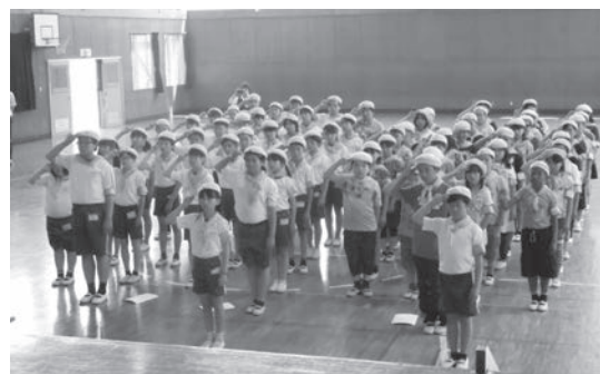
奥野小学校の入団式の様子

さらに、12月には作品の入賞者の表彰式が行われ、入賞作品のカレンダーを作成するなど広く交通事故防止に活用されます。