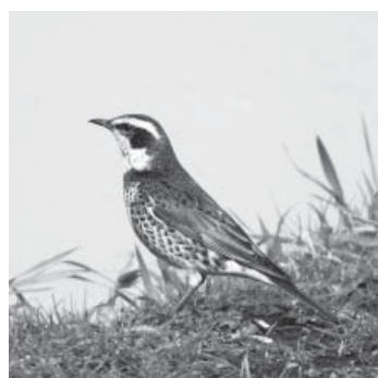
スズメ目ツグミ科

白い眉斑と翼の赤茶色、胸のうろこ模様が特徴で、ムクドリくらいの大ささですが、胸を張った姿勢がスマートに見えます。積雪のない地方に冬鳥として渡来し、農耕地や草原、公園などの開けた場所がよく見られます。寒い間は単独で行動し、果実や枯草の下にいる虫などを食べていますが、3月中旬ごろから少しずつ群れになり北へと帰って行きます。日本で見られる時期はさえずらないため、「口をつぐんでいる鳥」の意からツグミと名付けられたといわれています。