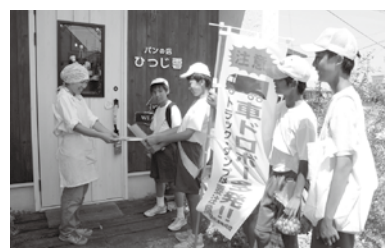
防犯を呼び掛ける牛久南中学校の生徒

牛久警察署長・牛久地区防犯協会長から「一日防犯連絡員」の委嘱を受け、市内全5校の中学生96人が、防犯連絡員、牛久警察署員、少年指導委員等と、それぞれの学区内の家庭を訪問して、防犯について注意を呼び掛け、啓発品を配布しました。