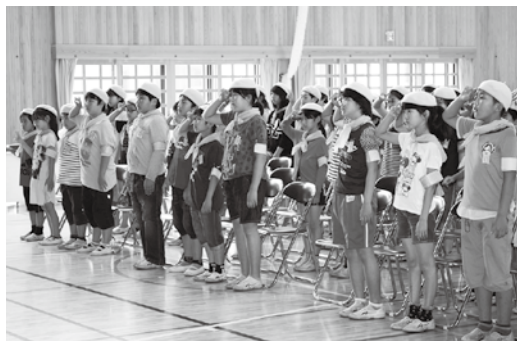
岡田小学校の入団式の様子

5月26日、岡田小学校において交通安全少年団の入団式が行われ、新たに5年生95人が交通安全少年団員に任命されました。市内の5、6年生1,513人からなる交通安全少年団員は積極的に交通事故防止の活動をし、毎月1・10・20日の学校登校日(休日はその翌日)に黄色のベレー帽、腕章、スカーフを身につけて登下校し、自らの交通安全の意識を高めています。また、夏休み中には交通安全の標語やポスターを作成し、交通事故防止を呼びかけています。