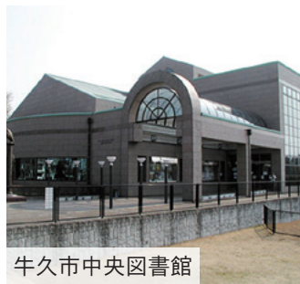
牛久市中央図書館