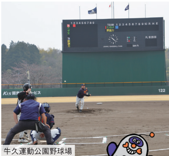
牛久運動公園野球場