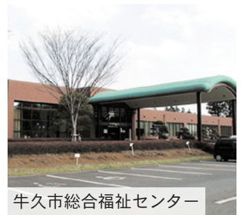
牛久市総合福祉センター