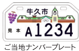
ご当地ナンバープレート