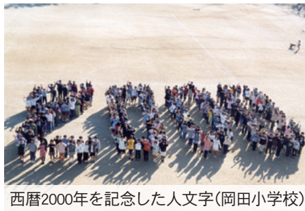
西暦2000年を記念した人文字(岡田小学校)