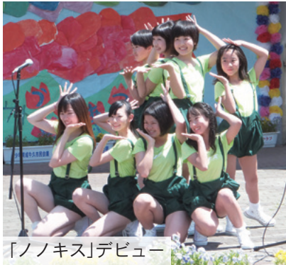
「ノノキス」デビュー