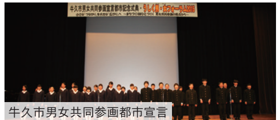
牛久市男女共同参画都市宣言