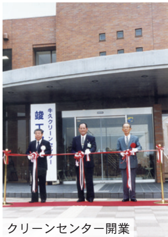
クリーンセンター開業