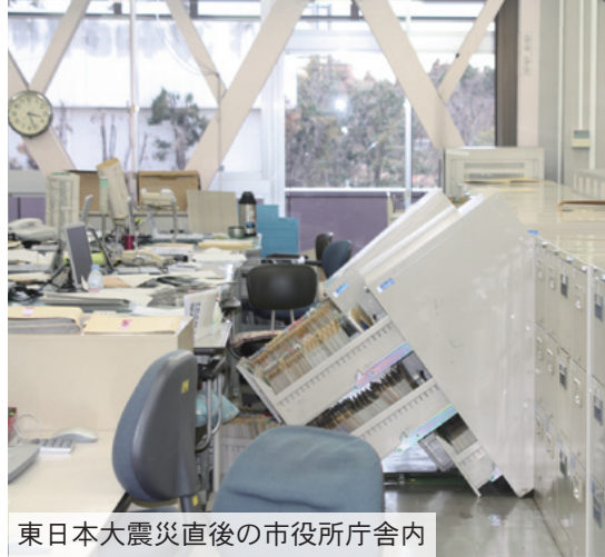
東日本大震災直後の市役所庁舎内