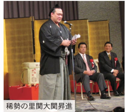
稀勢の里関大関昇進