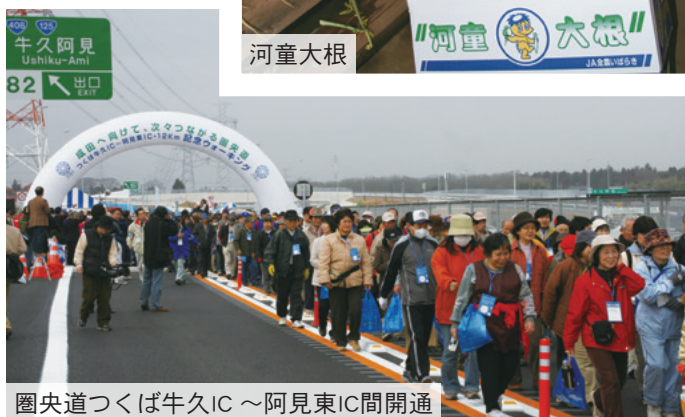
圏央道つくば牛久IC～阿見東IC間開通