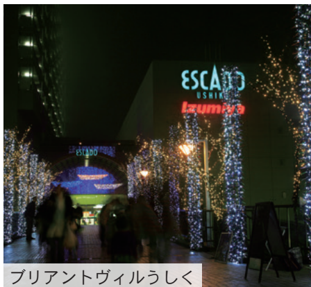
ブリアントヴィルうしく