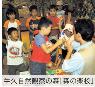
牛久自然観察の森「森の楽校」