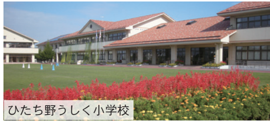
ひたち野うしく小学校