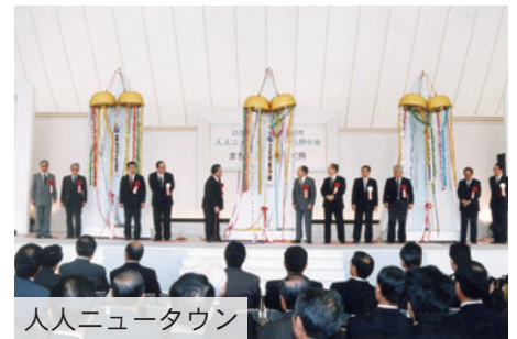
人人ニュータウン