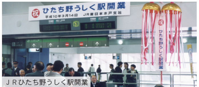
JRひたち野うしく駅開業