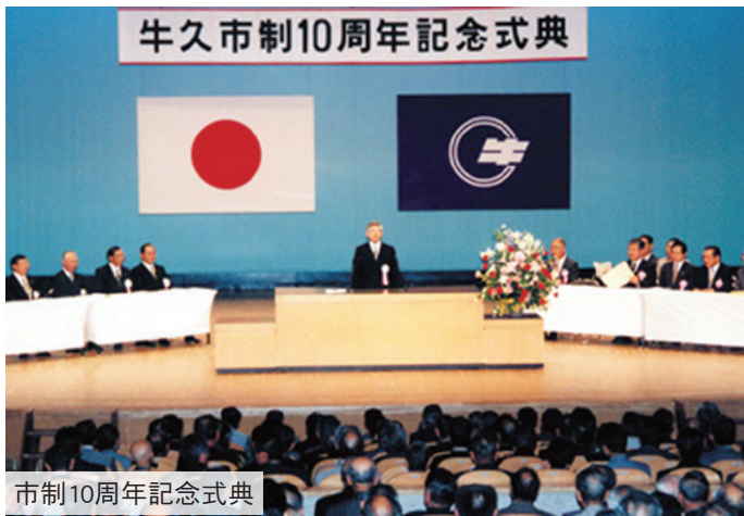
市制10周年記念式典