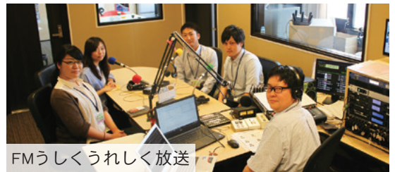
FMうしくうれしく放送