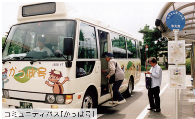
コミュニティバス「かっぱ号」