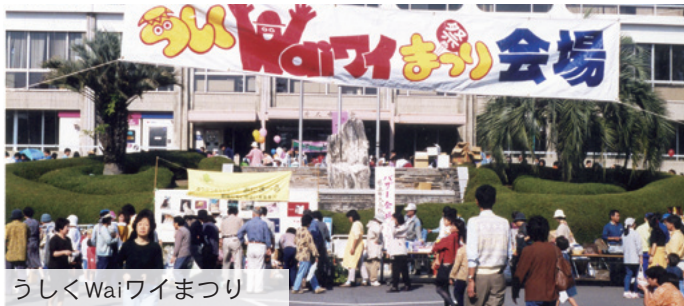
うしくWaiワイまつり