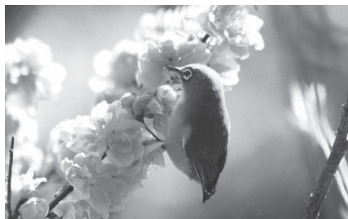
スズメ目メジロ科

スズメよりひと回り小さく、黄緑色の上面と白っぽい腹部、目の周りの白いリングが特徴です。平地から低山地の里山に生息し、冬から春にかけて果実や花の蜜を求めて庭や公園にもやってきます。人をあまり恐れず、目にすることも多いため、観察しやすい野鳥の一つです。