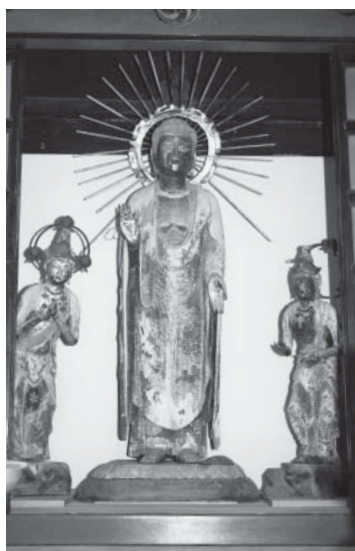
右：観音菩薩像(像高95.3cm) 中央：阿弥陀如来像(像高162.8cm) 左：勢至菩薩像(像高102.3cm)

◆種別 彫刻 ◆指定年月日 平成20年9月26日 ◆所在地 井ノ岡町 ◆制作時代 鎌倉時代後期