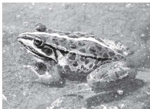
アカガエル科 (東京達磨蛙)

田植えが終わった後の田んぼや水路などで見られる中型の力エルで、背中の真ん中にある黄緑色のすじが目立ちます。親になってからも水辺を離れずに生活し、頬の両側を膨らませて「ゲゲッ、ゲゲッ」と鳴きます。「トノサマガエル」と呼ばれることもあります。仙台平野から関東平野に分布しているのは本種です。