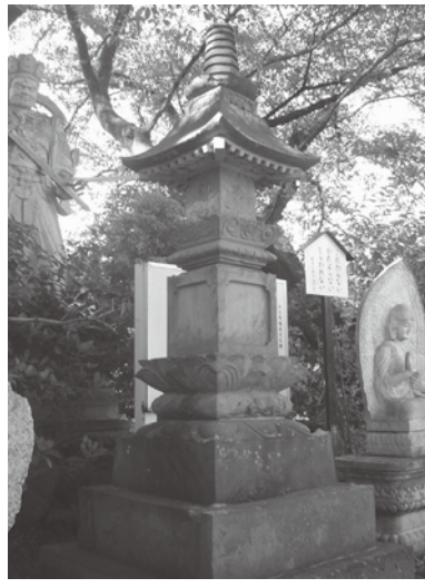
田宮山薬師寺境内の宝篋印塔