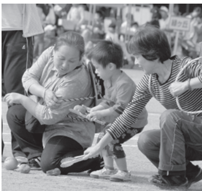
牛久地区の種目「今晚のおかず」