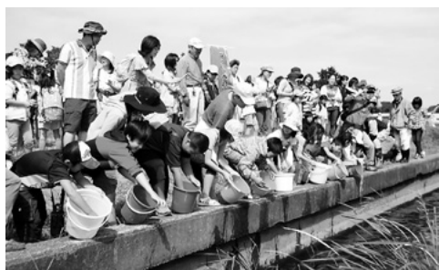
ウナギの成長を願い放流をする参加者たち

当日は、77人の市内小学生親子が参加し、元気なウナギの稚魚250匹を放流。また、城中部の昆虫や草木の自然観察も行われ、牛久沼周辺の豊かな自然を満喫しました。