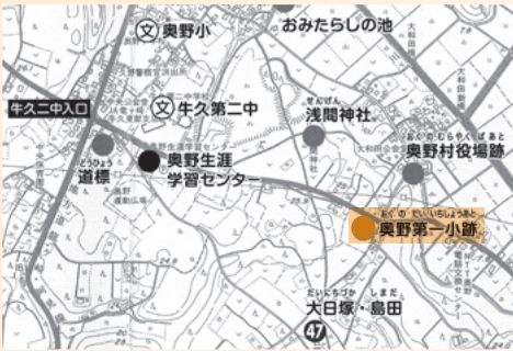
奥野第一小学校の場所