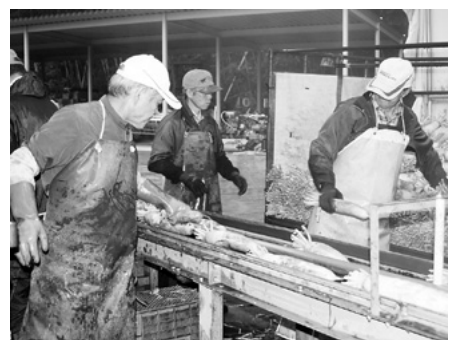
洗浄選別機を次々と通り、出荷の準備が進む河童大根

10月15日、小坂町のJA竜ヶ崎市牛久宮農経済センターで河童大根の目揃会が行われました。