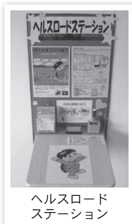
ヘルスロード ステーション