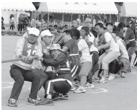
白熱した岡田地区の種目「綱引き」

ダービー」では、大人や子どもと一緒に馬跳び競争を行いました。軽快な子どもチームに対し、出遅れる大人チームに会場からは声援と笑い声が起こるなど、どの会場でも秋のひと時、市民同士が交流を深めていました。