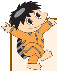
生涯かっぱつ キューちゃん