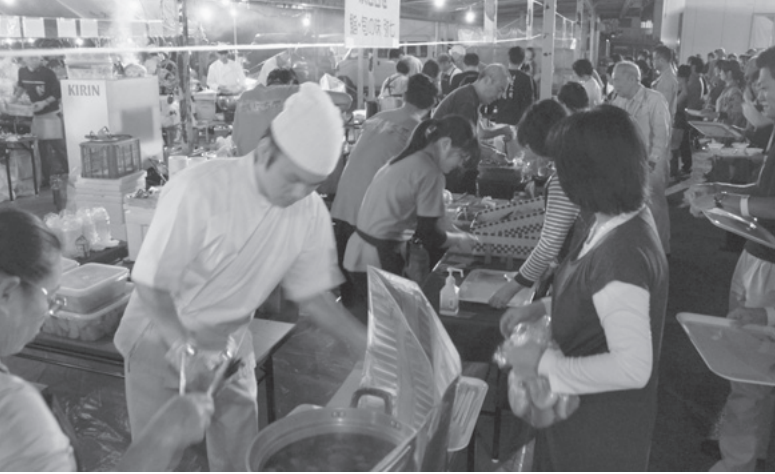
地元産のおいしい料理に参加者の行列が絶えませんでした