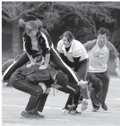
奥野地区の種目「万馬券ダービー」では、みんなで楽しく馬跳び競争

牛久運動広場で行われた牛久地区の種目「今晚のおかず」では、参加者たちはグラウンドに並べられた「今晚のおかず」になるジャガイモやニンジンをつまんでかごに入れ、競争。牛久運動公園で行われた岡田地区の種目「綱引き」では、子どもたちがメガホンを片手にチームを応援。見事、勝ち上がると「やった、勝った!」と跳び上がって喜んでいました。奥野運動広場で行われた奥野地区の種目「万馬券