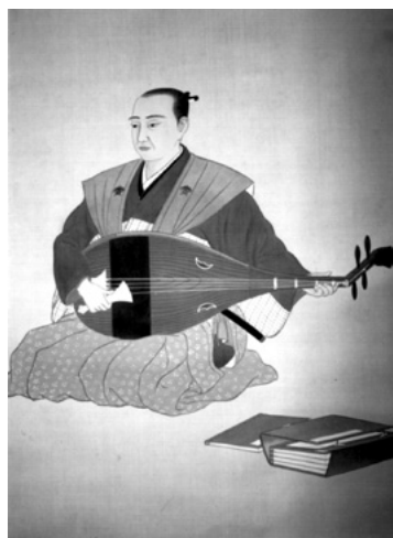
熊沢蕃山肖像画

正則の所領が49万8千石余から4万5千石余に減封となったため、家臣の多くが浪人となった。蕃山の実父野尻藤兵衛一利と養父熊沢半右衛門守久も浪人となった。