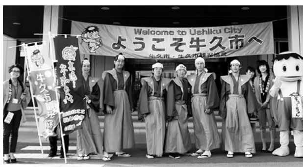
映画と併せていわき市のPRをする宣伝隊「リアル！参勤交代」のメンバー6人

6月19日、映画「超高速！参勤交代」のPRのため、宣伝隊「リアル！参勤交代」が徒歩で牛久市役所を訪れました。