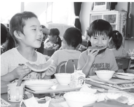
うしく河童西瓜は子どもたちにも大人気

奥野小学校でも、目揃会を終え たばかりのうしく河童西瓜が子ど もたちに提供されました。この日 の西瓜は奥野地区で採れたものが 中心で、1年生のクラスでは「う ちの近くでも作ってる、おいしい んだよ」と、地元の味を自慢する 声が上がりました。子どもたちは、 西瓜の赤い果肉が見えなくなるま ですっかり食べて、笑顔で給食を 完食していました。