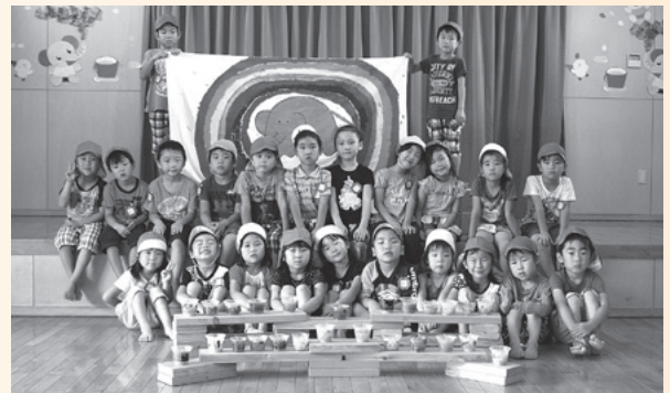
そらぐみとたいようぐみの 5歳児「ぞうグループ」

ふたばランド保育園のお友だちは、運動あそびを楽しんだ後、手作りの旗とキャンドルを披露してくれました。