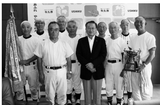
ユニホーム姿で駆けつけた「うしくゴールデンボーイズ」の皆さん

10月に還暦は兵庫県、古希は鳥取県で開催される全国大会に出場します。元氣な皆さんの活躍が期待されています。