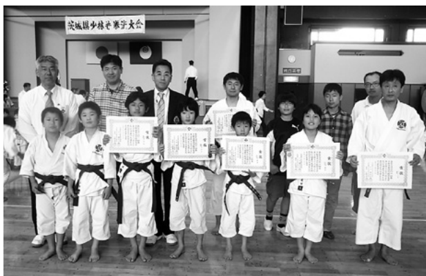
各賞を受賞し喜ぶ選手の皆さん