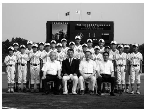
牛久運動公園野球場での壮行会

大会は、全国12連盟代表16リーグにより6月27日から開会。牛久リーグは1回戦（東海連盟・知多）に1対0で辛くも勝利しましたが、ベスト4をかけた2回戦（関西連盟・大阪茨木）では、最終回まで5点リードするものの守りきれず、8対9で残念ながら惜敗しました。