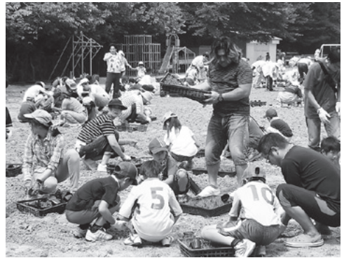
皆さんの協力で順調に進む芝生植え

6月21日、牛久第二小学校校庭 で、芝生植え付け作業が実施され ました。校庭芝生化事業は、ス ポーツ振興くじ「toto」の助 成金を元に実施されたもので、芝 生の植え付けにはPTAや地域の 皆さん、市職員らボランティア約 450人が参加しました。