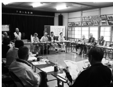
▲下根ヶ丘会館たまり場 シニアクラブの定例会の様子

「たまり場」とは、集会所や区民会館を地域の人々に広く開放し、市民活動の場所として無料で提供するにより、地域コミュニティの活性化を目指す事業のことです。たまり場として開放している集会所や区民会館は、行政区内外問わず、誰でも使用することができ、それぞれの行政区での決まり