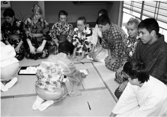
お茶の作法や道具に皆さんも興味津々

初めのうちは帯がきつそうでしたが、慣れるにつれて、鏡で自分の浴衣姿を確認していました。