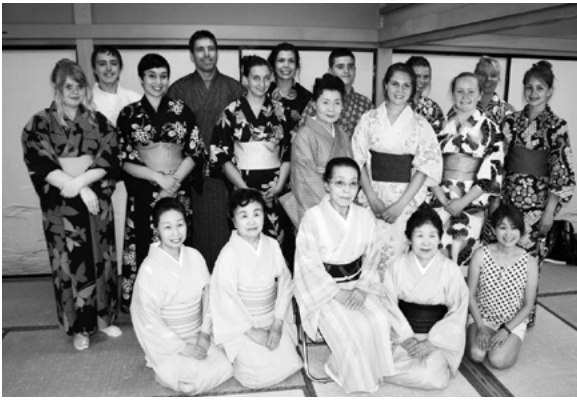
浴衣を着て踊った後、記念撮影

初めての浴衣の着付けでは、市民の方から寄贈された浴衣の中から、自分で気に入った色のものを選び着付けしてもらいました。