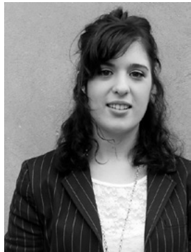
お見掛けした際はお気軽にお声掛けください

7月21日から10月16日までの滞在期間中は、市役所での職場体験や市内の高校・小中学校訪問などをする予定です。お見掛けした際はお気軽にお声掛けください。