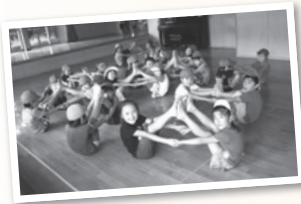
▲ニヨキニヨキやま