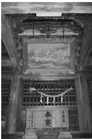
【羽成観音(上および右写真)】

妙印尼が建立した七観音の一つ。所在地は、つくば市羽成で、羽成山普賢院実城寺に隣接。