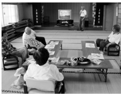
▲上柏田区民会館たまり場 集会所でカラオケを楽しむ 地域の方々

に従ってください。行政区の枠を超え、さまざまな年代の方々がスポーツ・コース・手芸・語学など、多種多様な活動の場として「たまり場」を活用されています。また、気軽におしゃべりを楽しむことができるサロンを企画している行政区もあります。たまり場活動を実施している行政区には月額7万円の補助金が市から出ています。