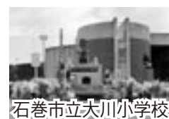
石巻市立大川小学校

内容 平成24・25・26年の各3月、福島・宮城・岩手県を巡ってファインダー越しに目の当たり