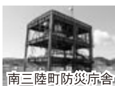
南三陸町防災庁舎

内容 平成24・25・26年の各3月、福島・宮城・岩手県を巡ってファインダー越しに目の当たり