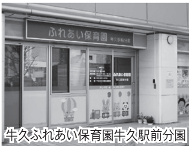
牛久ふれあい保育園牛久駅前分園