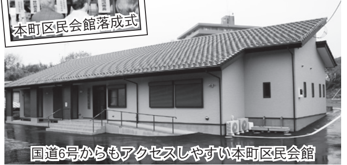
国道6号からもアクセスしやすい本町区民会館