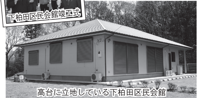
高台に立地している下柏田区民会館