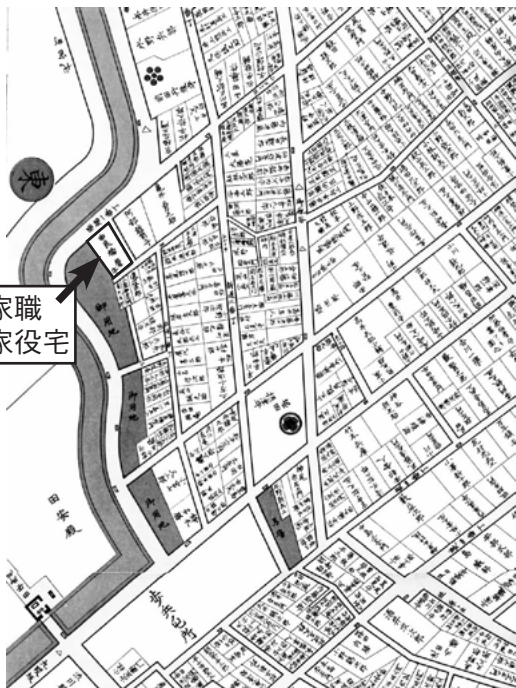
高家職・由良播磨守貞靖・貞時の役宅(番町の堀端一番丁。田安門付近)所在地。 【嘉永・慶応版の江戸切絵図より】 自邸は堀端一番丁の半蔵門よりに構えていた。

高家職には格があつて、高家に就任できる家の当主が、年令が若いとかで任ぜられない場合、その家を表高家と呼び、高家に就いた場合は、奥高家と呼んだ。主任に相当する役職を肝煎高家と呼んだ。