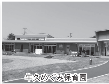
牛久めぐみ保育園