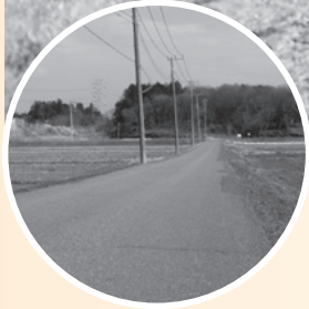
◀現在の一本橋付近

この写真は昭和35年5月、田植え作業中の休憩の様子です。下根町と上柏田をつなぐ「一本橋」付近から撮影されました。