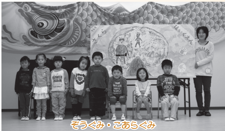
ぞうぐみ・こあらぐみ

▲3人の年長さん(ぞうぐみ)とその作品。こあらぐみのおともだちも仲良く遊んでいます。