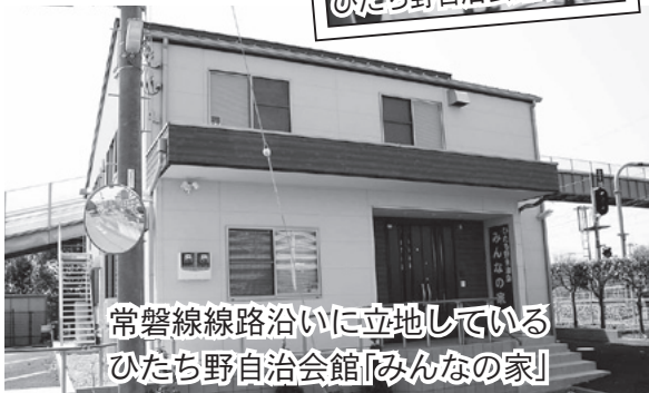
常磐線線路沿いに立地している ひたち野自治会館「みんなの家」