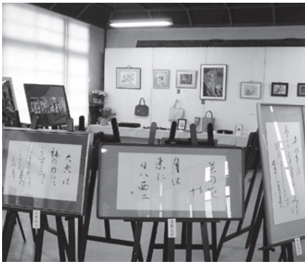
書や版画などの作品150点を展示

今回のギャラリー展は、これまで同研修所で開催された講座の講師と受講生OBによる作品展で、絵画、写真、刺繍、書、版画などは、ボランティアグループ「コスモス会」による、春の香りといったの手作りの草もち、五目弁当などの販売もありました。来場者は、同研修所の歴史的な建物やその豊かな自然環境を満喫しながら、文化・芸術に触れ、「春一番のおもてなし」を感じられる春祭りとなりました。