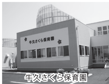
牛久さくら保育園

今年も新しい認可保育園がオープン 市では、子育てしやすい環境づくりに力を入れています。就労などのため家庭で保育できないときに、安心してお子さんを預けていただけるよう、毎年保育園を増やし、定員を増やしています。 今年私立の保育園が、2月に牛久駅前エスカードビル1階に1園、4月に下根町に2園開園しました。 問 保育園課 ☎ 内線 1761