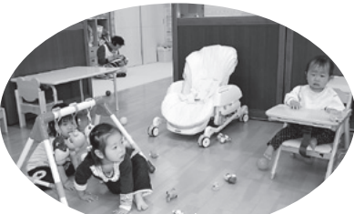
新しい園内で子どもたちも安心 (牛久ふれあい保育園牛久駅前分園)