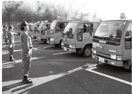
消防車両の機械器具点検をする消防団員

1月11日、市中央生涯学習センターで「平成26年牛久市消防出初式」が行われました。この出初式は、新年にあたり、牛久市を火災・災害から守り、消防業務の安全な遂行を祈念して毎年行われています。