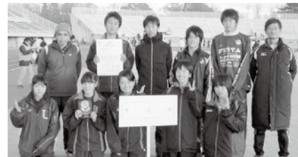
第4位に入賞した牛久市チーム