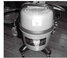
助成を受け、行政区が購入した掃除機

下柏田行 行政区では、財団法人自治総合センターからコミュニティ助成事業の助成金250万円の助成を受け、コミュニティ活動の推進を図るための備品(食器棚や机、椅子など)を購入しました。