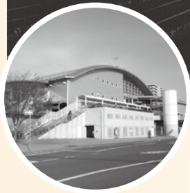
◀現在の様子(ひたち野うしく駅)

この写真は、1980年代後半に撮影された、万博中央駅跡地に残された駅舎の一部です。