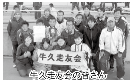
牛久走友会の皆さん