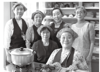
メニューを考えた牛久市ヘルスメイトの皆さん

ウイナーソーセージは斜めに薄く切ったほうが、旨みと塩味が白菜全体に広がりやすくなります。