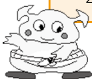
牛久市健診イメージキャラクター メタ坊くん