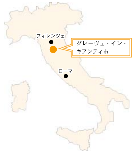
イタリアのトスカーナ州 グレーヴェ・イン・キアンティ市の位置