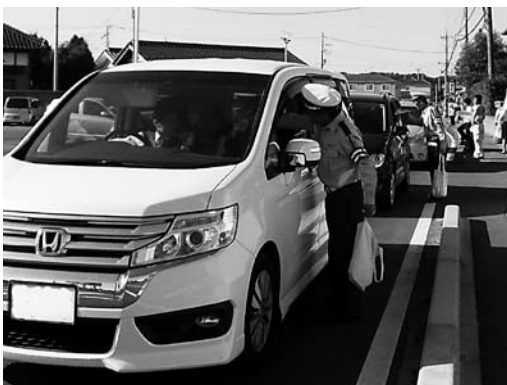
ドライバーに安全運転を呼び掛け

早朝7時30分から牛久市交通安全対策協議会や牛久警察署などの関係団体約70人が参加し、赤信号で停止した車の運転者や歩行者に、シートベルトの着用と交通事故防止を呼び掛けました。それに合わせて、新米と反射キーホルダー、チラシなどの交通安全啓発品を配布しました。このような街頭キャンペーンは年間4回実施されています。