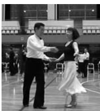
チャリティーダンスパーティーの様です。