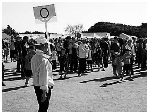
「〇×ゲーム」では、文化ホールの席数などが出題されました(岡田地区)