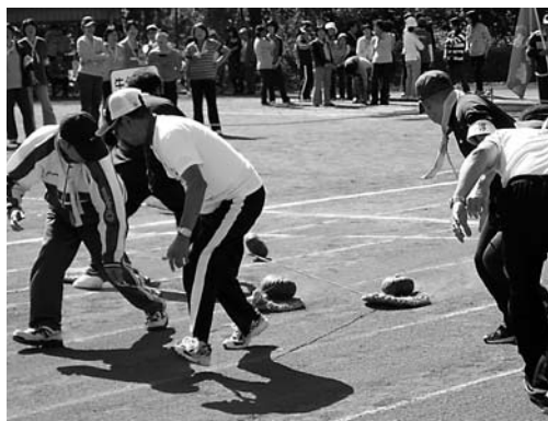
「かぼちゃ引きリレー」では、コロコロ転がるかぼちゃに四苦八苦(奥野地区)

10月13日、牛久・岡田・奥野各地区で市民体育祭が行われました。奥野地区では、俵ポッチに大き