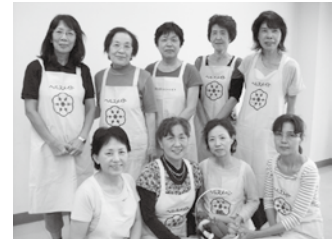
メニューを考えた 牛久市ヘルスマイトの皆さん

和風のお惣菜を下準備から仕上げまでフライパンひとつで手軽に作りましょう。ひじきを短時間でもどすので、うまみもしっかり残り、うす味でもおいしく仕上がります。ふたをして蒸し煮にすることで、ふっくらと軟らかくなり、お子さんも食べやすくなります。