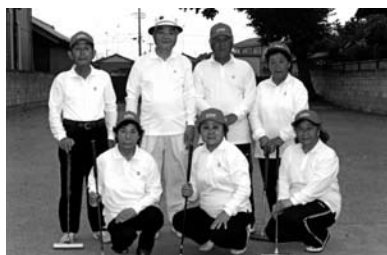
ねんりんピックよさこい高知2013 平成25年10月26日～28日 チーム名：牛久豊友会 うしくほうゆうかい