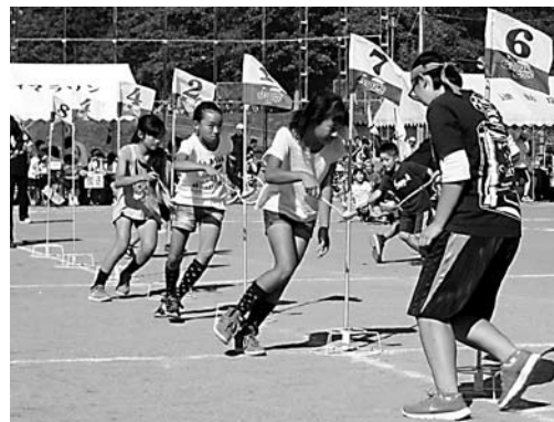
「スプーンレース」では子どもたちの顔も真剣(牛久地区)

なかぼちゃを載せてバランスとスピードを競う「かぼちゃ引きリレー」が行われ、勢い余って転倒するランナーも出るなど、会場は大いに盛り上がりました。岡田地区では、〇×エリアに分かれて勝ち抜き戦を行う「〇×ゲーム」を実施。頭も使う種目に参加者は歓声を上げていました。牛久地区の「スプーンレース」では、参加者は悪戦苦闘しながらスプーンの上に載せたボールを落とさないように走っていました。どの会場でも、健康増進を図りながら、市民同士が交流を深めました。