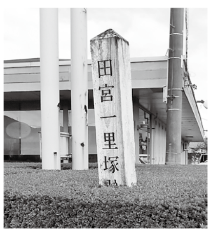
現在の田宮一里塚跡(上り側)