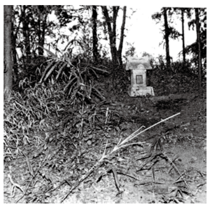
田宮一里塚(上り側)・昭和54年撮影

往時、同一里塚は、江戸・日本橋を基点に数えると16番目であったが、二基いずれも消滅している。下り側の一里塚が昭和41年に消滅し、もう一方の上り側の一里塚は昭和54年(写真はこの年撮影された)以降に消滅している。