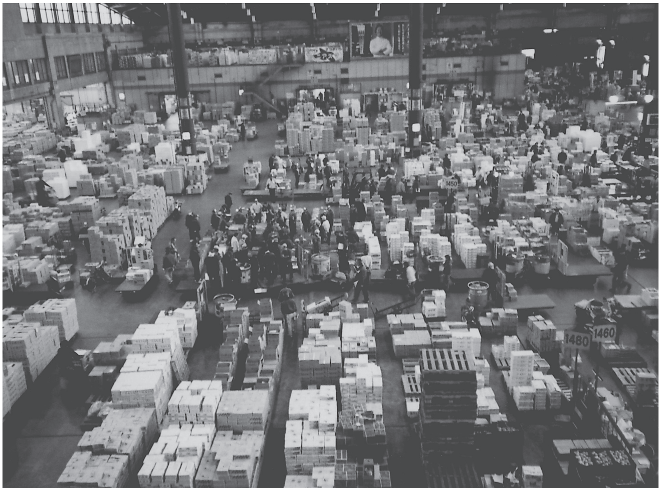
早朝の活気溢れる太田市場

発行所 牛久市農業委員会 住 所 牛久市中央3-15-1 電 話 029-873-2111(代) 再生紙を使用しています